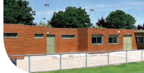
Réalisation Société Yves Cougnaud Silverwood Natur - Fauve