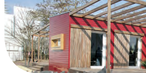
Ma Maison pour Agir - Futuroscope Silverwood Extra - Rouge Sang de Boeuf